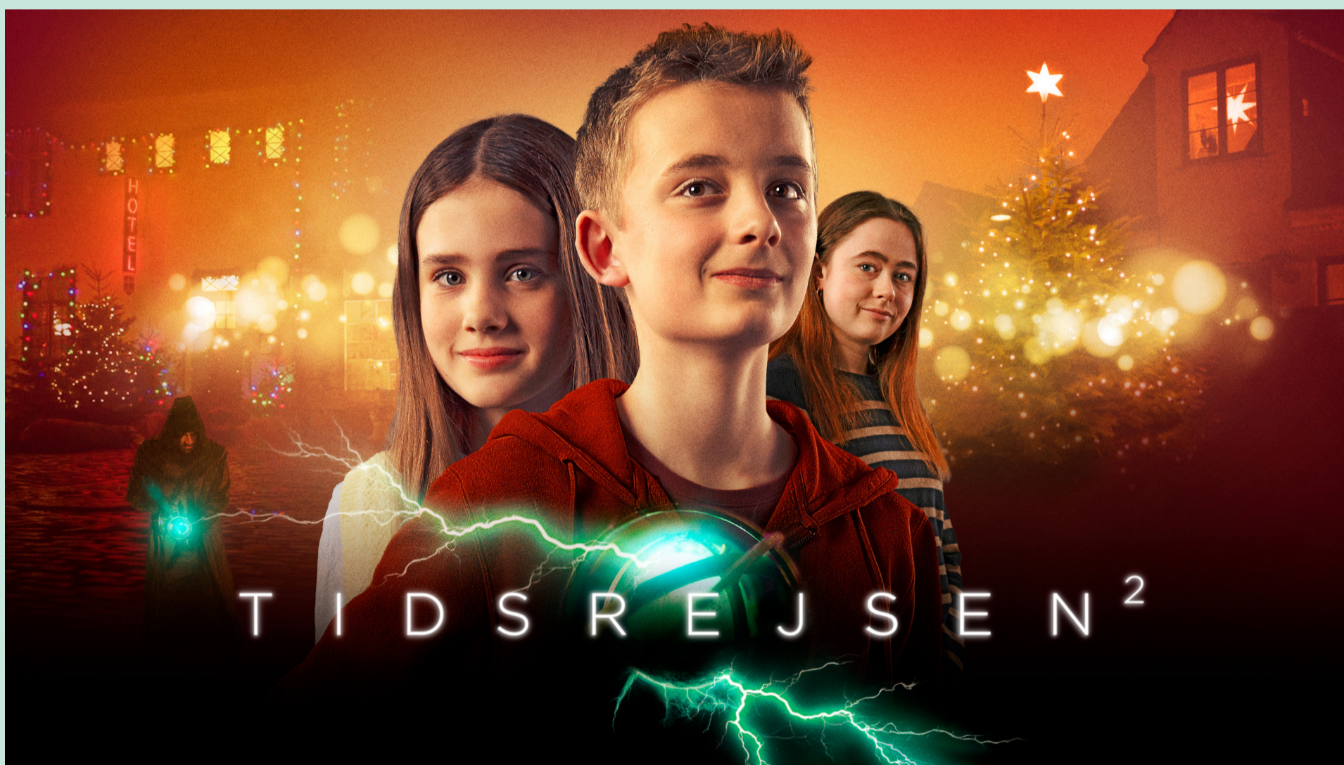
Fotograf: Thomas Gerhardt / Grafik: Mia Selin / Fotografi: Christian Geisnæs

Nogle af hovedpersonerne i bøgerne rejser gennem tiden. De bruger alle en bestemt maskine, genstand eller et sted til at rejse. Forbind bogen med det rigtige "tidsrejse-værktøj" ved at tegne en streg mellem dem.